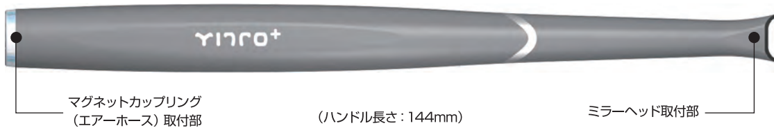
マグネットカップリング (エアアース) 取付部

軽さはもちろんのこと、持ちやすさと重量バランスを考慮したミラーハンドル部。エアアース取付部にはマグネット式を採用し、術中のミラー交換も簡単かつスピーディーに行うことができます。 (写真はほぼ実物大)