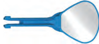
ミラーヘッド no.2 ミラー部 幅 : 18.2mm 長さ : 16.8mm