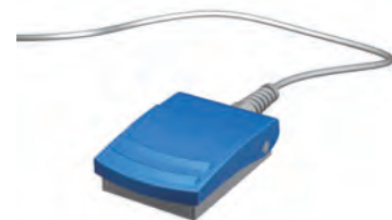
フットペダル 【YPMAC-0268】 ※2

※1 本品は、L型のユニット取付用ホルダーです。標準添付されているユニバーサルドッキングホルダーを設置できない場合のオプション部品です。